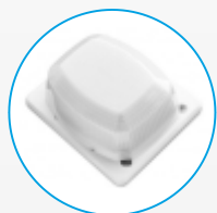
GEN-L1 Bezprzewodowy sygnalizator optyczno-akustyczny