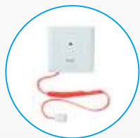
GEN-CT Bezprzewodowy pociągany przycisk przywoławczy z wbudowanym przyciskiem kasowania