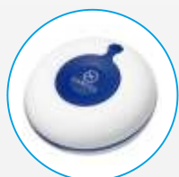
GEN-CC Bezprzewodowy przycisk anulowania przywoławczy